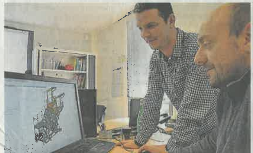
Le bureau d'études d'AT Industrie a récemment mis au point une passerelle modulable adaptée à l'entretien de trois modèles d'avions chez Boeing.

finalement gérer l'atelier et une trentaine de personnes. Malgré la fermeture de l'entreprise, je savais que les compétences dans l'accès technique en hauteur étaient indéniables. La bonne santé d'ATI en est la preuve », se félicite le Parthenaisien pur souche soucieux de valoriser le savoir-faire local. « Car il est bien réel et on doit en être fier. Il fallait juste optimiser notre outil de production, gagner en productivité par la concentration, la réflexion et l'organisation. » Sans doute la plus ingénieuse des passerelles conçue par ATI.